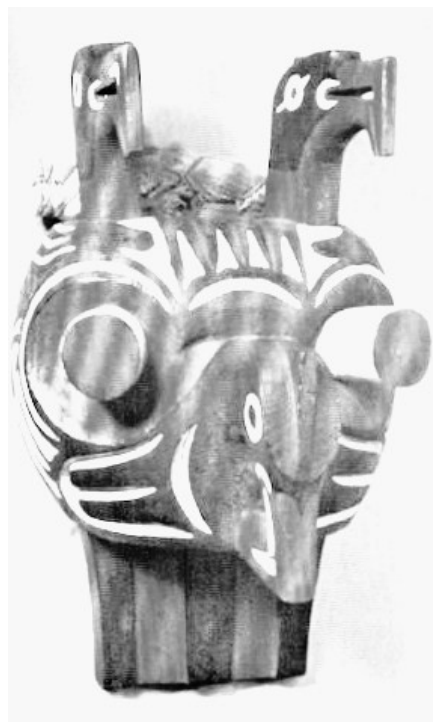
Maschera swaihvé (Salish).

Grato da sempre all'amico Marx Ernst e ai suoi frottages , frutto di accostamenti inconsueti, ed abituato per tradizione familiare a riconoscere i richiami interni di una composizione musicale, Lévi-Strauss accetta la sfida: si inoltra dunque nell'analisi di un argomento che coinvolge colori e suoni, e lo fa con la perizia dello scienziato che sa leggere i variegati elementi dei dati osservabili, ed è in grado di ordinarli lungo gli assi dei diversi codici (fisico, economico, sociologico, stilisti-