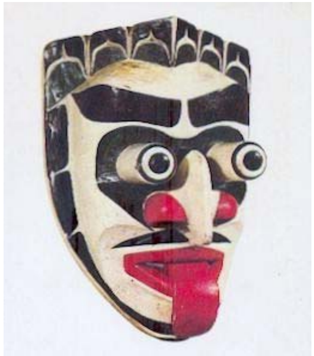
Maschera xwexwé (Kwakiutl).

Resta il fatto che, al momento, le due maschere risultano bloccate in una sorta di parallelismo, che lascia incompleto il loro significato. La risoluzione -paragonabile al movimento musicale della fuga - scaturisce dall'incontro/confronto con il mito della Signora dei